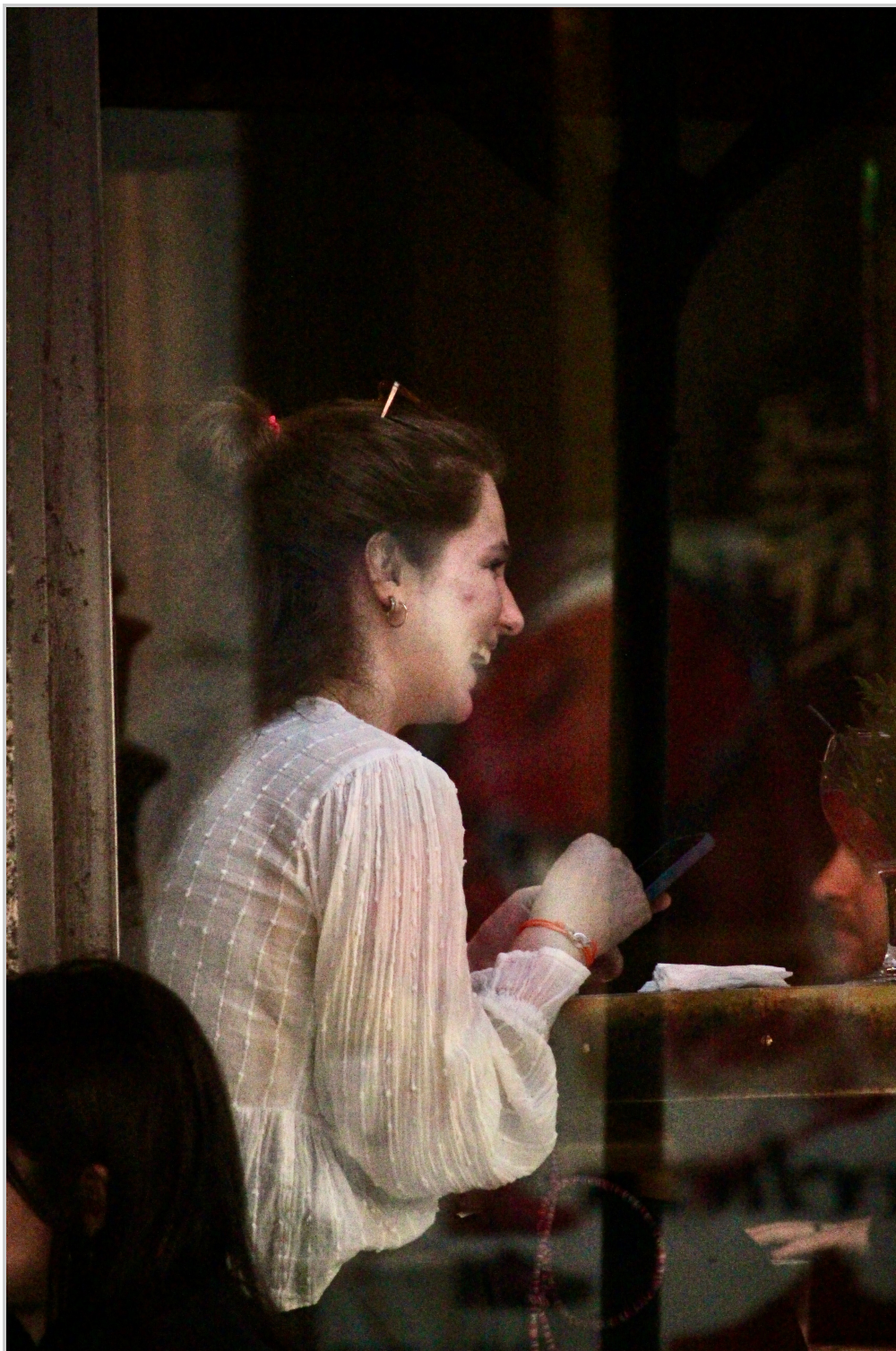
12. Chica risueña.