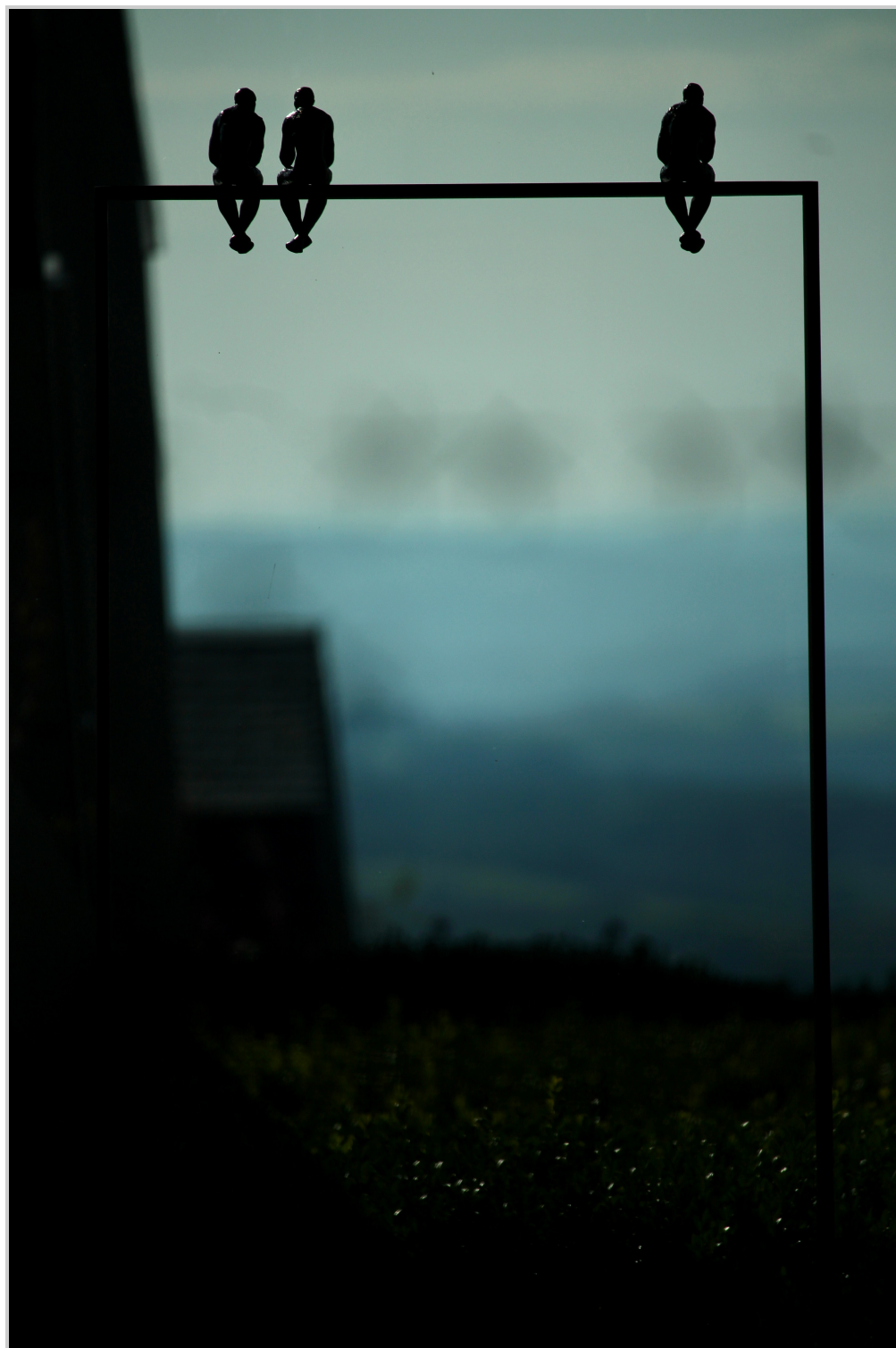
3. Michel Bras en Laguiole.