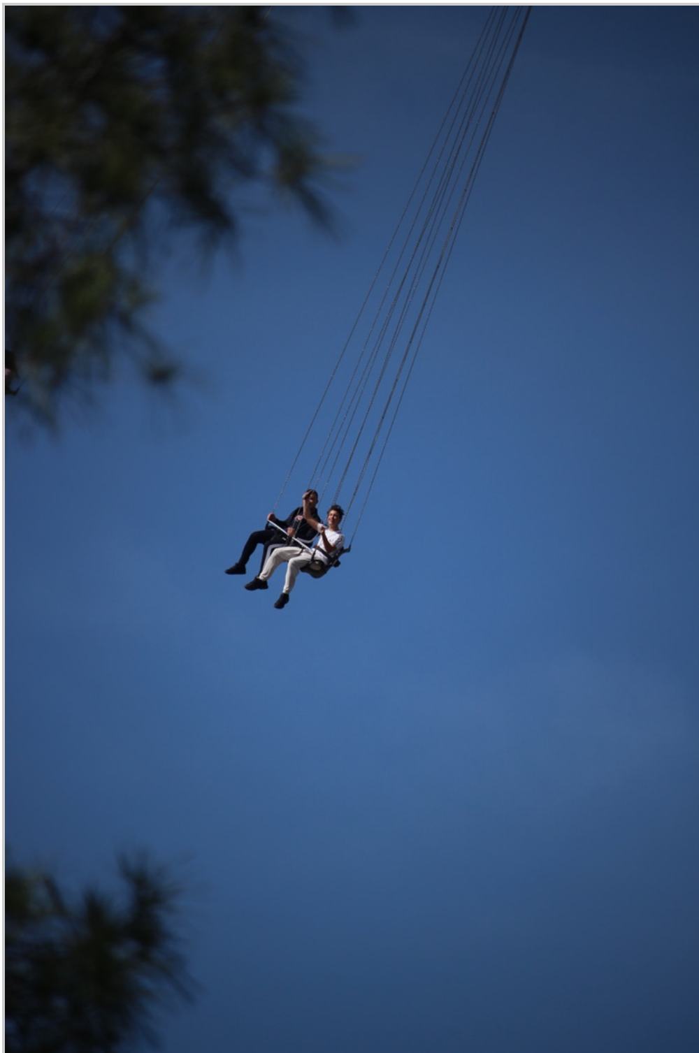
4. Silla voladora.