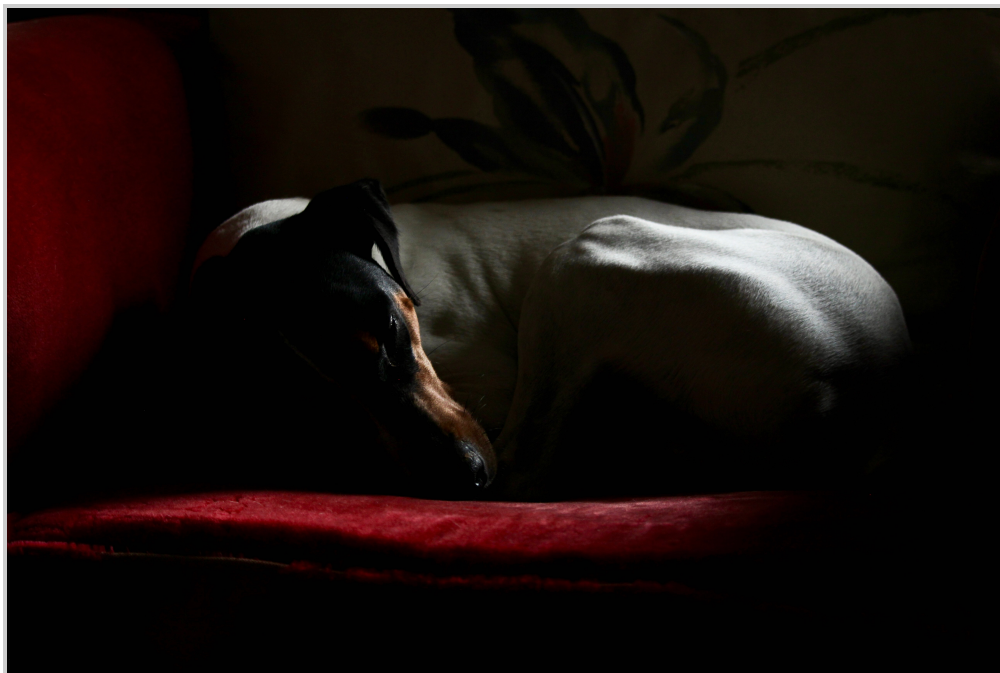
15. Ginkgo en sillón rojo.