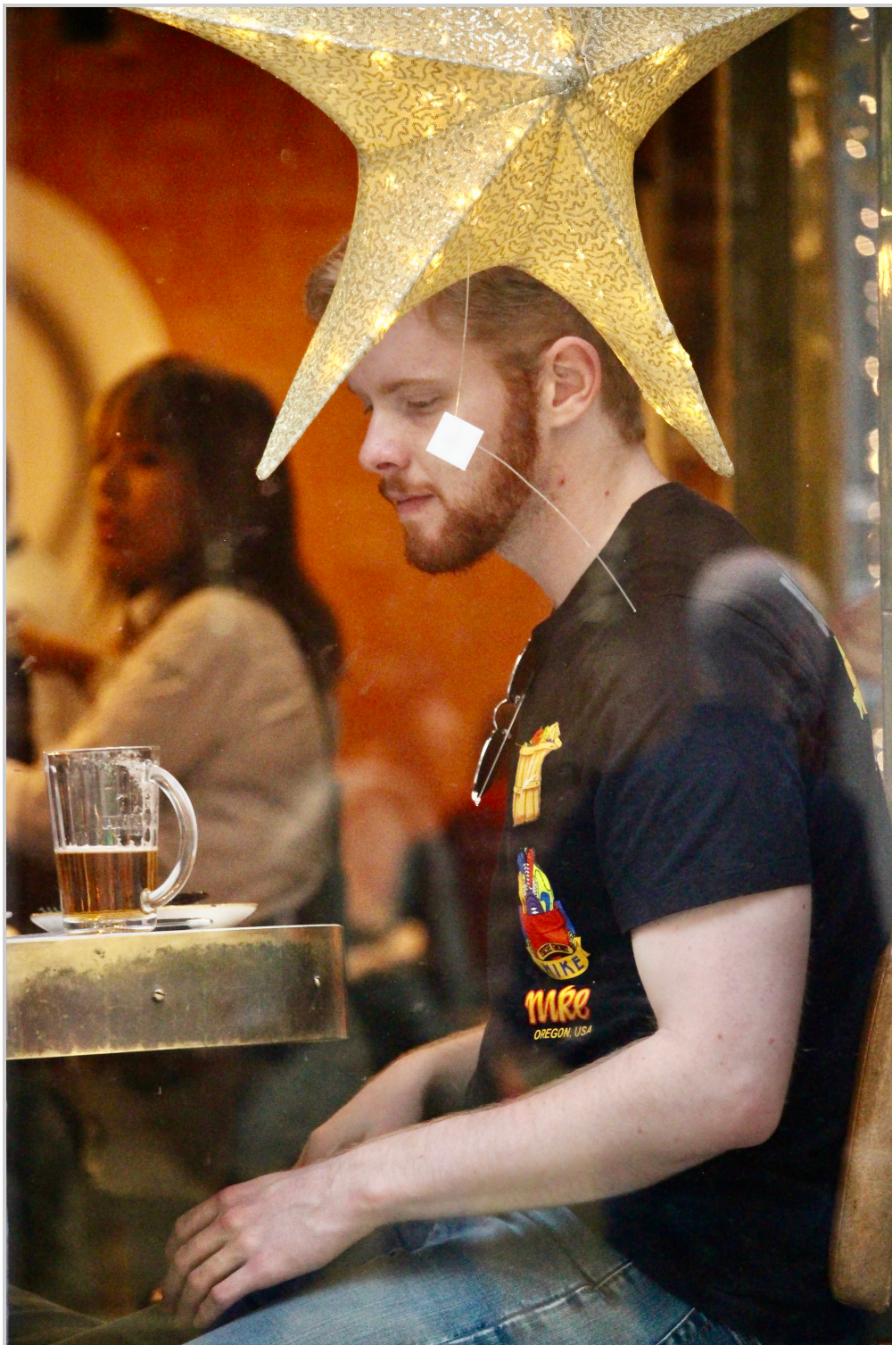
9. Chico con estrella.