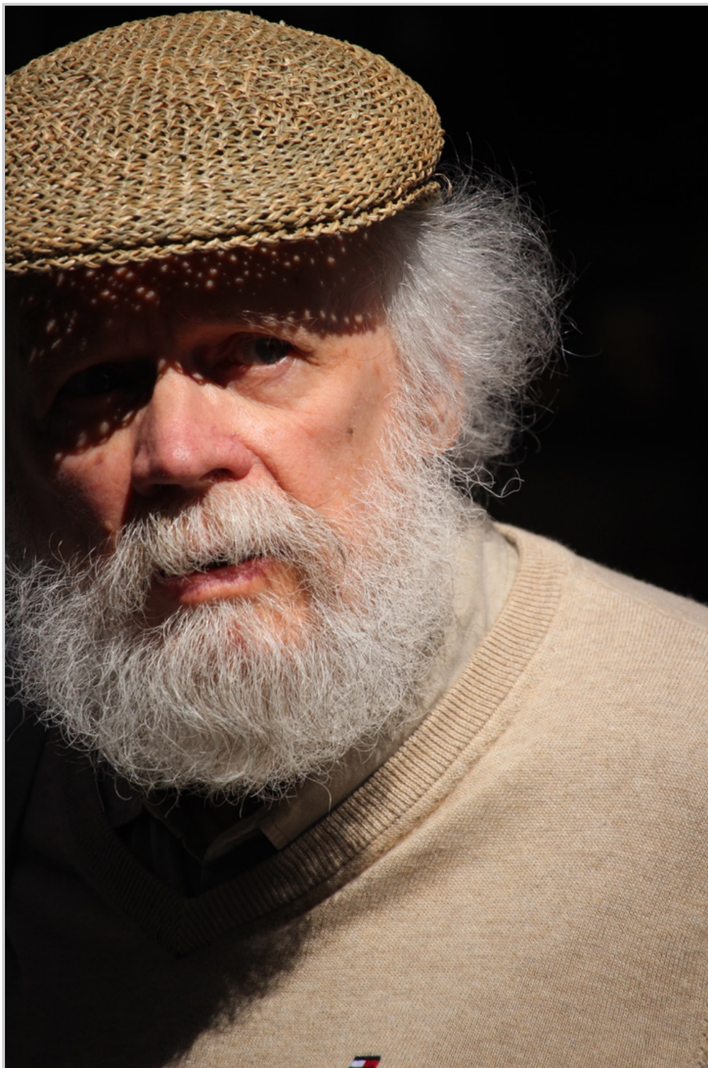
10. Hombre con barba.