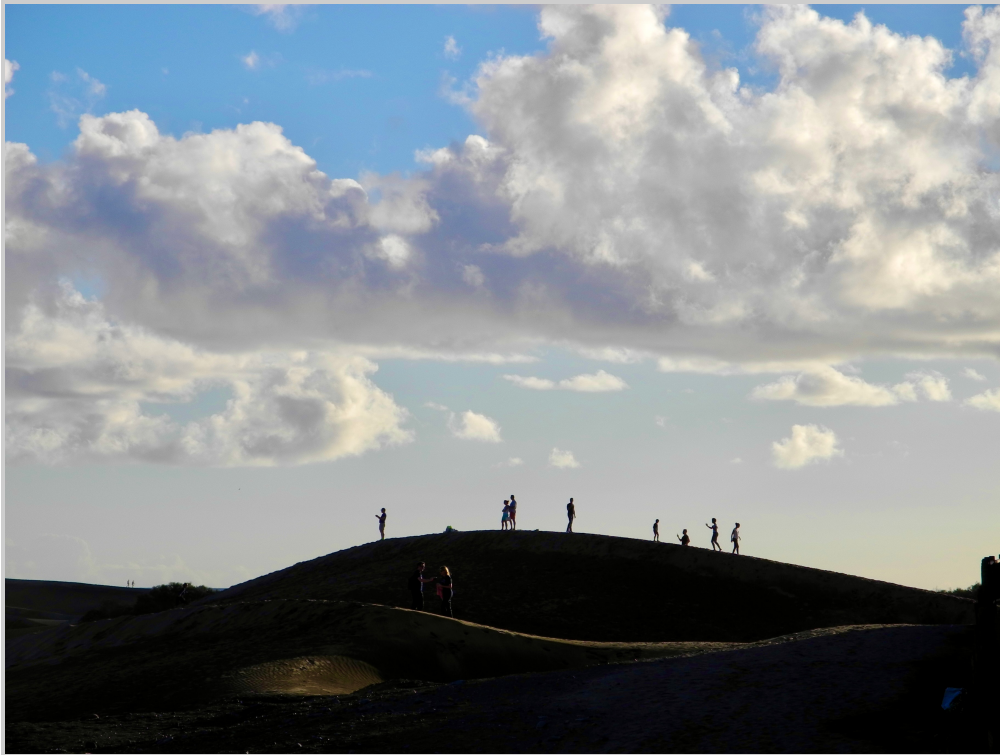
5. Dunas de Maspalomas.