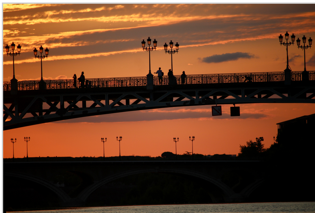
7. Pont Saint Pierre.