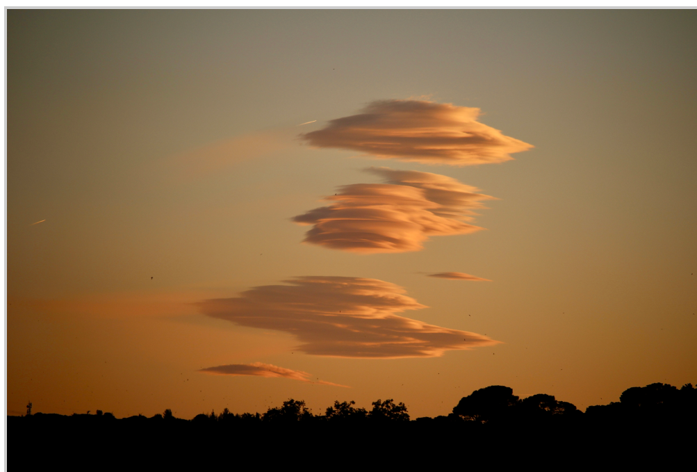
8. Puesta de sol.