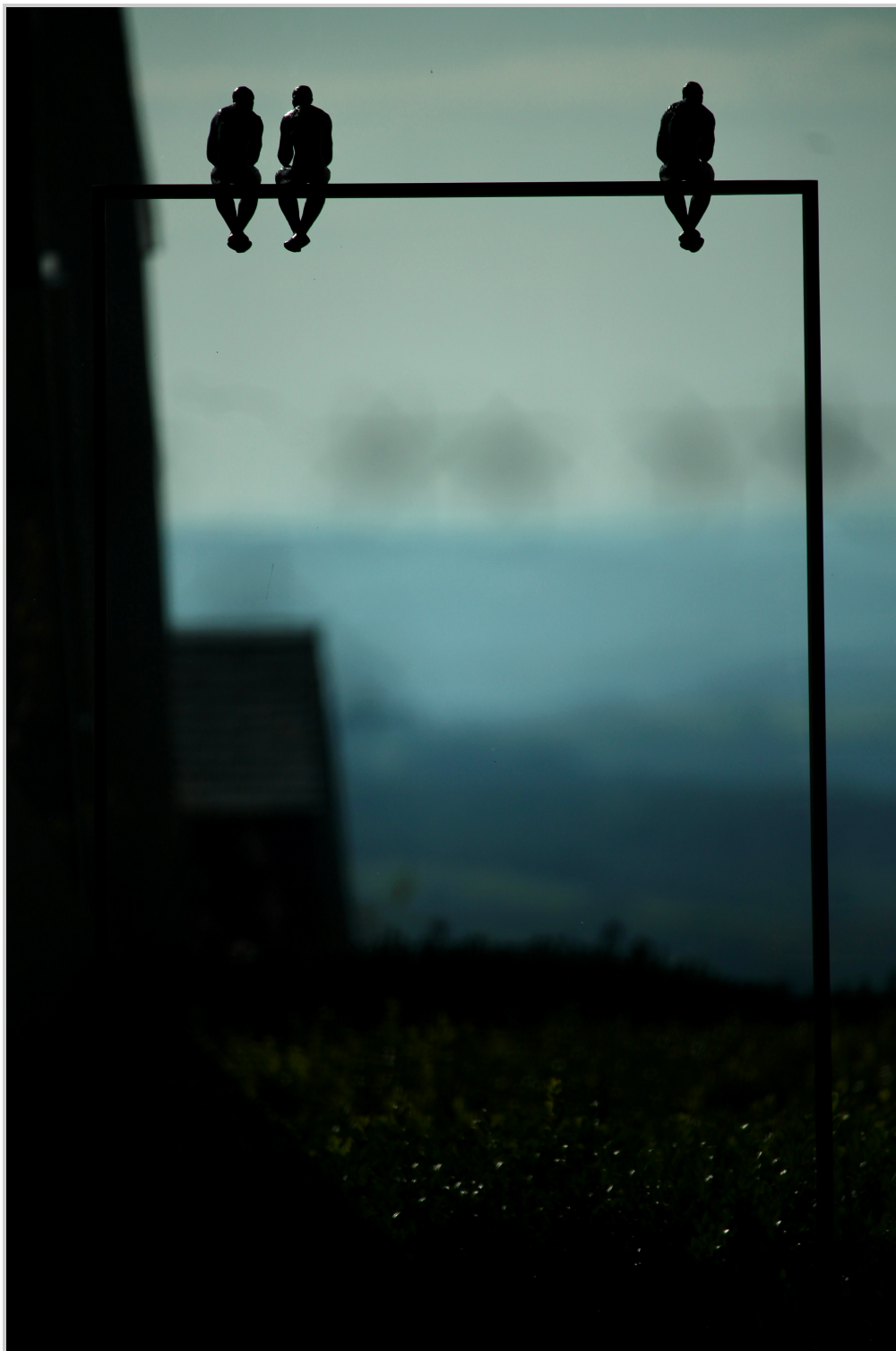
3. Michel Bras en Laguiole.