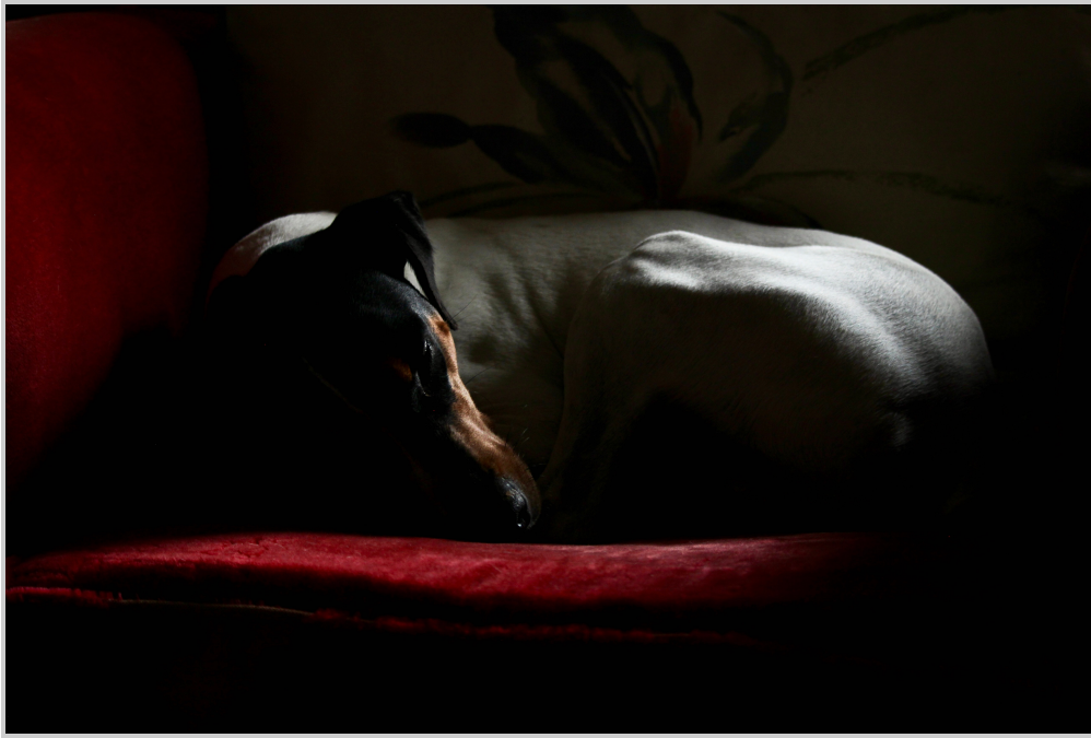
15. Ginkgo en sillón rojo.